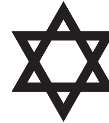
JØDEDOM, Tanakh som beskrevet forrige side.